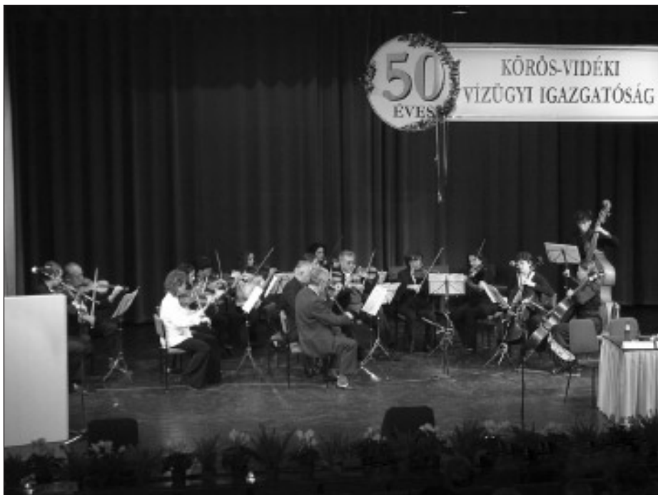
A Gyulai Vonós Kamarazenekar műsora

számunkra, hogy hazánk uniós csatlakozása és Románia csatlakozási szándéknyilatkozata új fejezetet nyit majd a határon átnyúló vízgazdálkodási együttműködés lehetőségeit illetően.