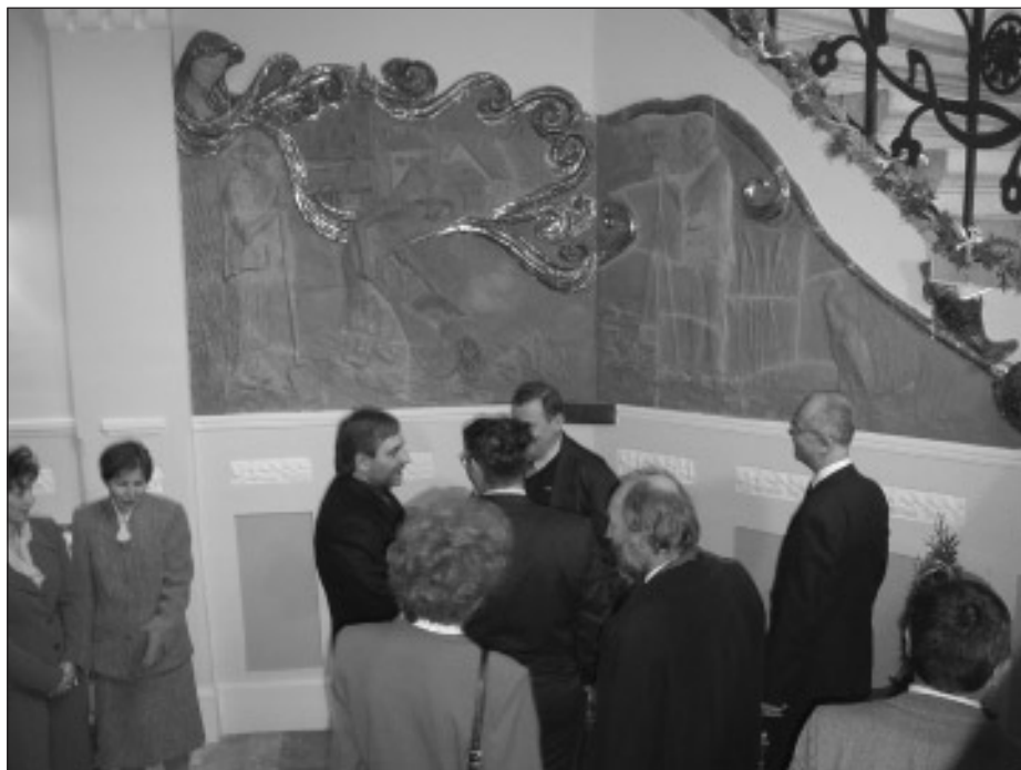
Folyó (Debreczeni Zsóka-Pelcz Zoltán alkotása)

feladatokkal megmaradni, és büszkék azért is, mert az ismétlődő ár- és belvizekkel szemben eredményesen megvívott csaták, valamint a térség vízgazdálkodási infrastruktúrájának fejlődése alapján úgy érezhetjük, nem szolgáltuk eredménytelenül a vizek ügyét.