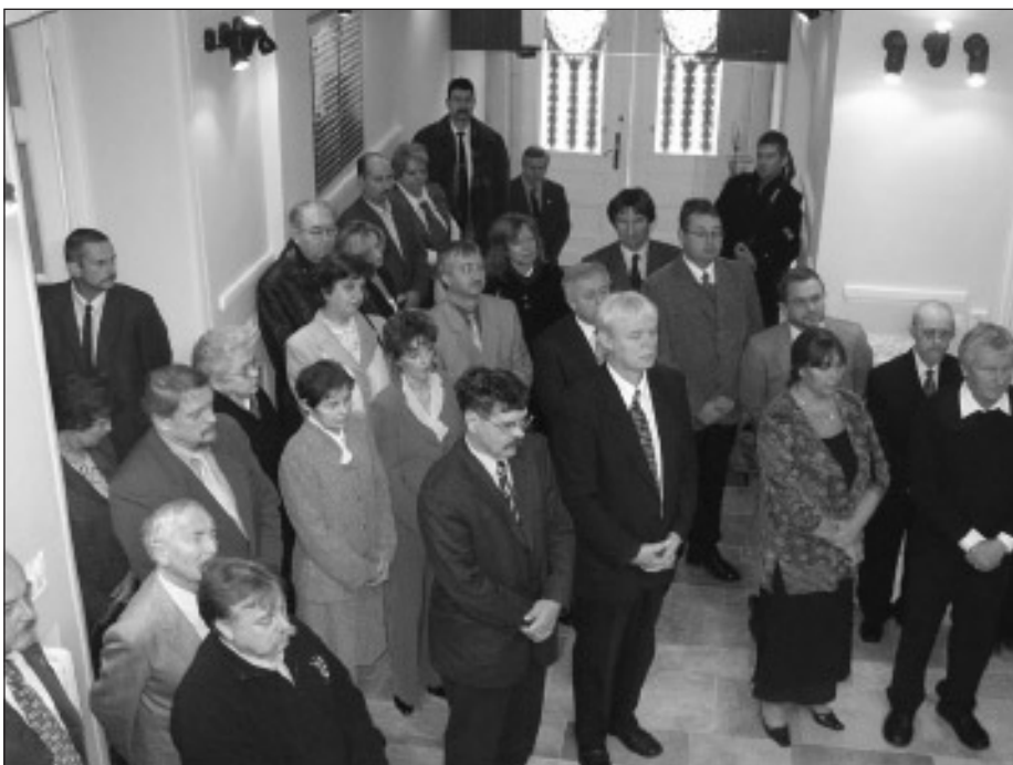
A domborműavató ünnepség

30-án jelent meg az a Kormányrendelet, amely alapján megalakult a Gyulai Vízügyi Igazgatóság.