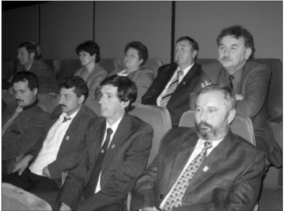
A résztvevők egy csoportja

A vízügyi államigazgatás kezdetei ugyanis hazánkban egészen II. József koráig, 1788-ig nyúlnak vissza, ekkor jött létre a Helytartótanácsnak és a Magyar Királyi Kamarának alárendelt