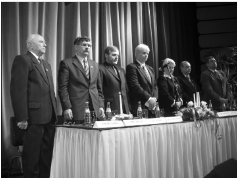
Emlékezés az elhunytakra