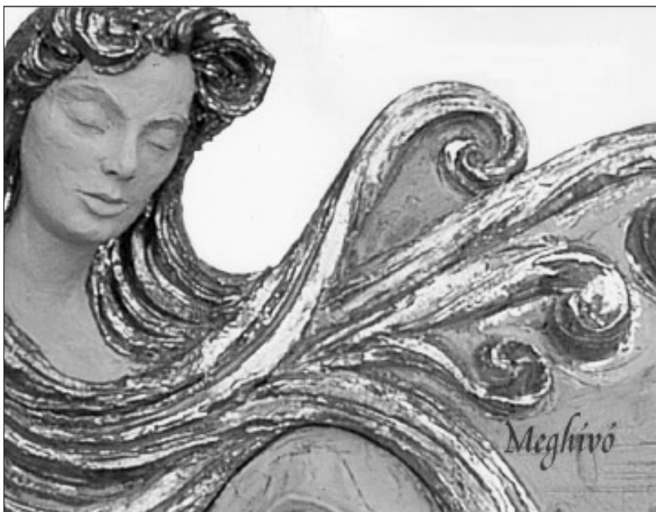
A dombormű részlete